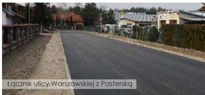
Łącznik ulicy Warszawskiej z Pasterską