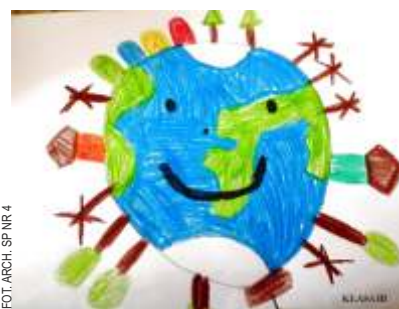
FOT. ARCH. SP NR 4

W Miejskim Przedszkolu nr 3 ogłoszono konkurs na wykonanie zabawki z materiałów wtórnych, część dzieci wzięła udział w akcji sprzątania świata. W Miejskim Przedszkolu nr 2 dzieci obserwowały rozkwitającą na wiosnę przyrodę w ogrodzie przedszkolnym, odbyły się zajęcia interaktywne dotyczące segregacji śmieci i recyklingu oraz zespołowe prace plastyczne. Przed-