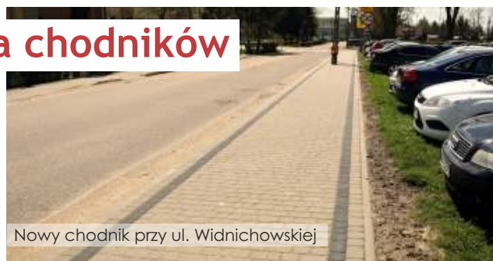
Nowy chodnik przy ul. Widnichowskiej