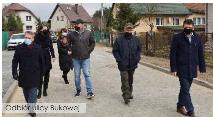
Odbiór ulicy Bukowej

Ulica Bukowa wykonana z kostki brukowej to odcinek ok. 69 m drogi położonej jest pomiędzy ulicami Brzozową i Akacjową. 7 kwietnia odbył się odbiór inwestycji zrealizowanej za kwotę 129 064,42 zł. Wykonano odwodnienie z odprowadzaniem wód opadowych do gruntu przez 3 studnie chłonne, dokonano przebudowy i wymiany linii oświetlenia ulicznego.