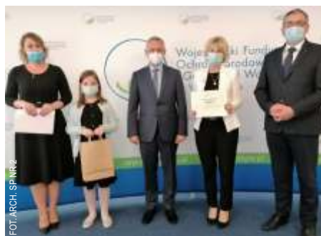
FOT. ARCH. SP NR 2

W szkołach poruszano zagadnienia segregacji śmieci oraz recyklingu, konieczności oszczędzania wody i energii, szacunku do przyrody, a także zagrożeń środowiska przyrodniczego. W Szkole Podstawowej nr 4 uczniowie swoje przemyślenia zobrazowali rysunkami do hasła: „Ziemia to nasz wspólny dom. Dbaj o Nią każdego dnia”. W Szkole Podsta-