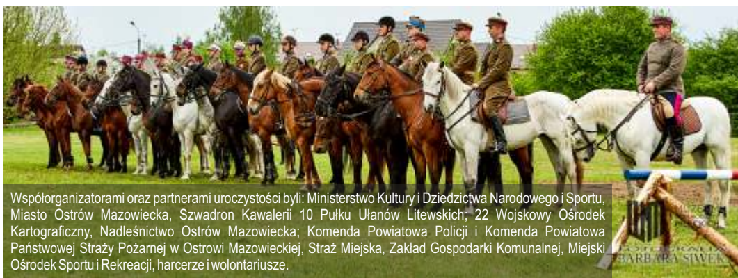
Współorganizatorami oraz partnerami uroczystości byli: Ministerstwo Kultury i Dziedzictwa Narodowego i Sportu, Miasto Ostrów Mazowiecka, Szwadron Kawalerii 10 Pułku Ułanów Litewskich; 22 Wojskowy Ośrodek Kartograficzny, Nadleśnictwo Ostrów Mazowiecka; Komenda Powiatowa Policji i Komenda Powiatowa Państwowej Straży Pożarnej w Ostrowi Mazowieckiej, Straż Miejska, Zakład Gospodarki Komunalnej, Miejski Ośrodek Sportu i Rekreacji, harcerze i wolontariusze.

Podczas I Zawodów Hippyckich im. rtm. Witolda Pileckiego, zaprezentowano kilka z nich: przegląd mundurowy (w tej konkurencji zwanej żartem przez niektórych „konkurencją piękności” sprawdza się czy zawodnik jest umundurowany i wyposażony, a koń stroczony zgodnie z regulaminem wojskowym); próbę terenową (popularnie zwaną „crosssem” – wg regulaminu Polskiego Związku Jeździeckiego); konkurs władania lanca