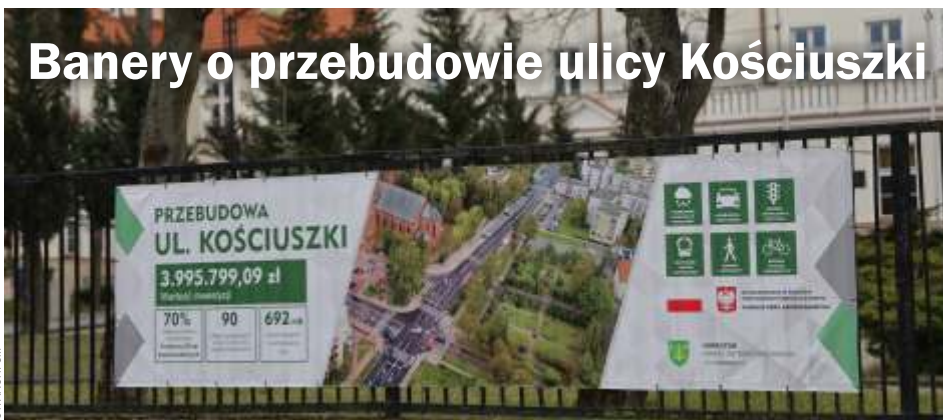
FOT. ARCH. UM

Na ul. Kościuszki pojawiły się banery informacyjne dotyczące przebudowy tej ulicy. Ostateczna kwota realizacji inwestycji, po rozliczeniu projektu, wyniosła 4 052 467,28 zł.