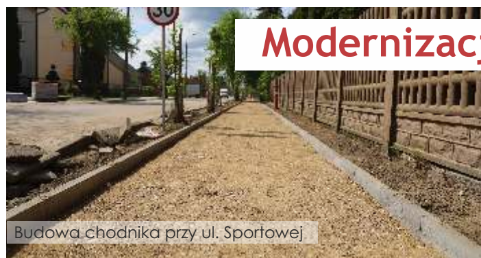
Budowa chodnika przy ul. Sportowej

Prezes Zarządu Zakładu Gospodarki Komunalnej Sp. z o.o.